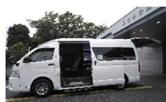
ハイエース霊柩（往復） 7人まで乗車可能 ¥33,250-