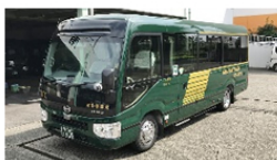
マイクロバス ¥43,700- 28人乗り ● 告別式時のマイクロバスの料金です。