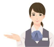
火葬場セレモレディ ● 追加料金 ¥9,900- ● 火葬場にて収骨が終わるまでの間、皆様が安心して過ごせるようにお付き添いいたします。