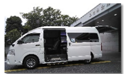
ハイエース霊柩（往復） 7人まで乗車可能 ¥30,250-